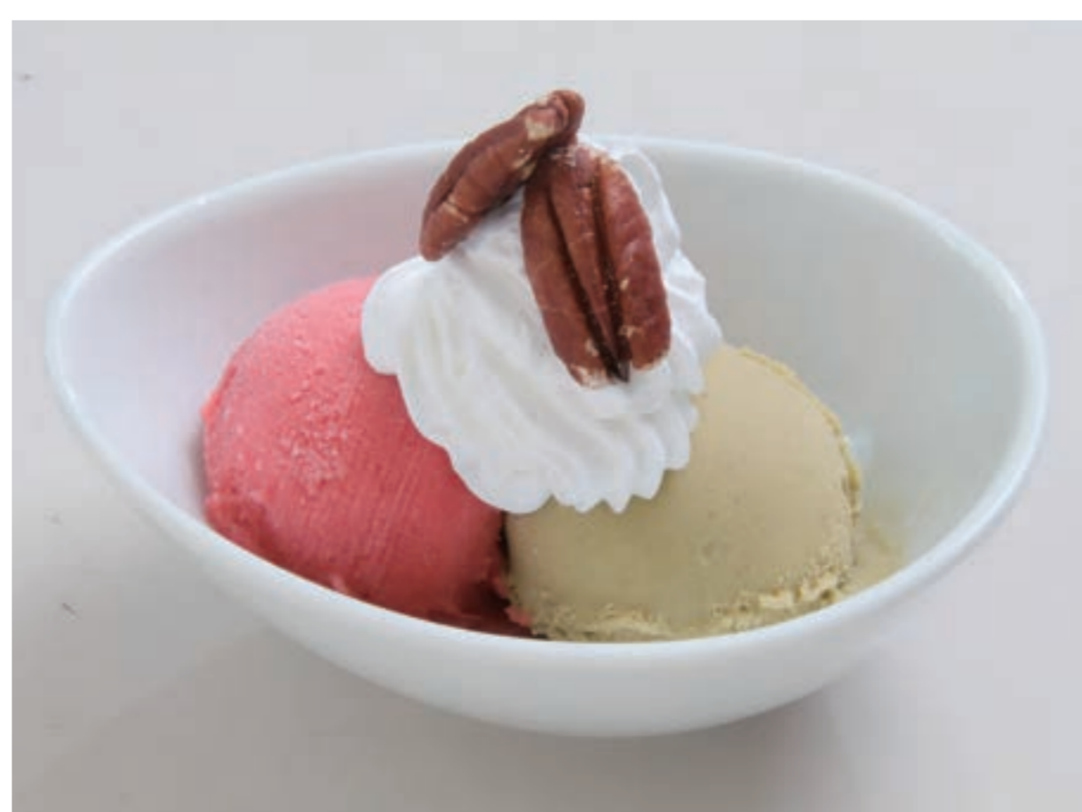
佐藤パフェアイス ¥800