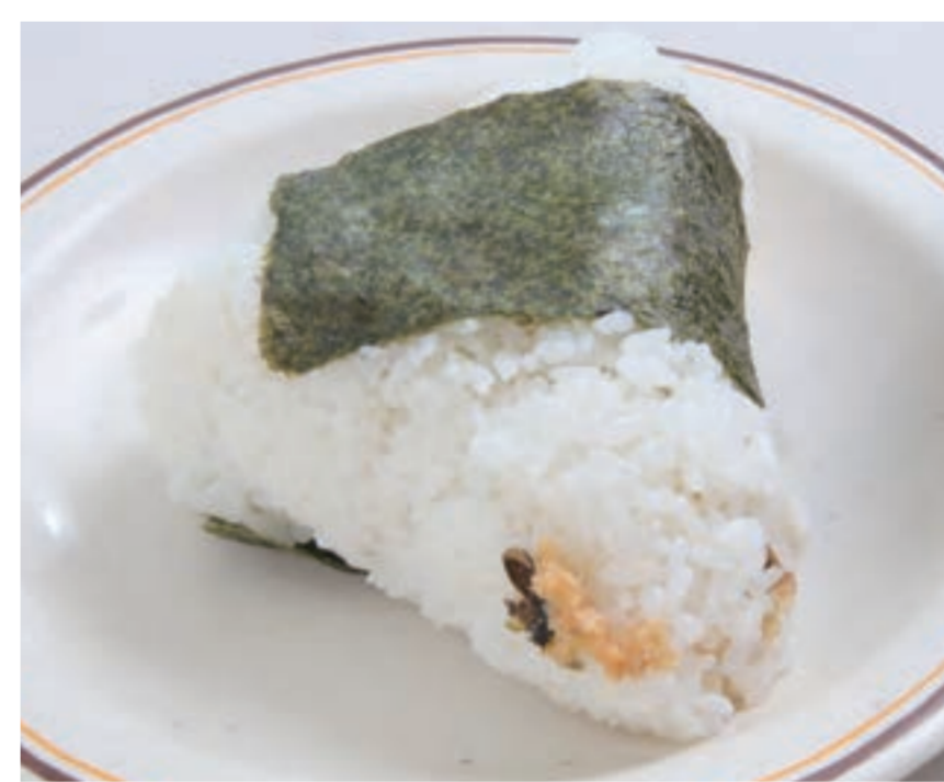
具だくさんおにぎり(鮭・梅・わさび) 各¥500