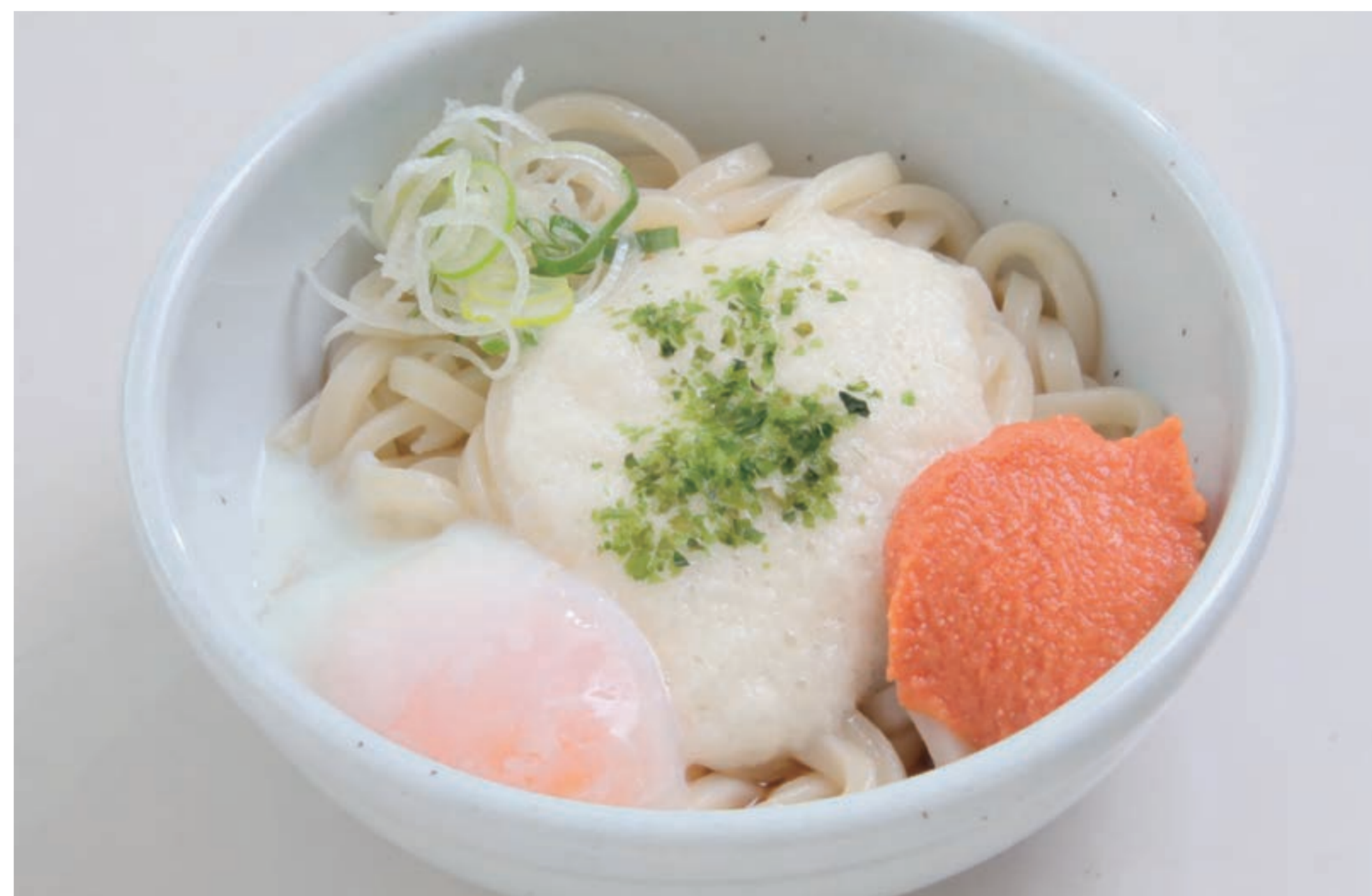
冷し明太玉うどん ¥1,000