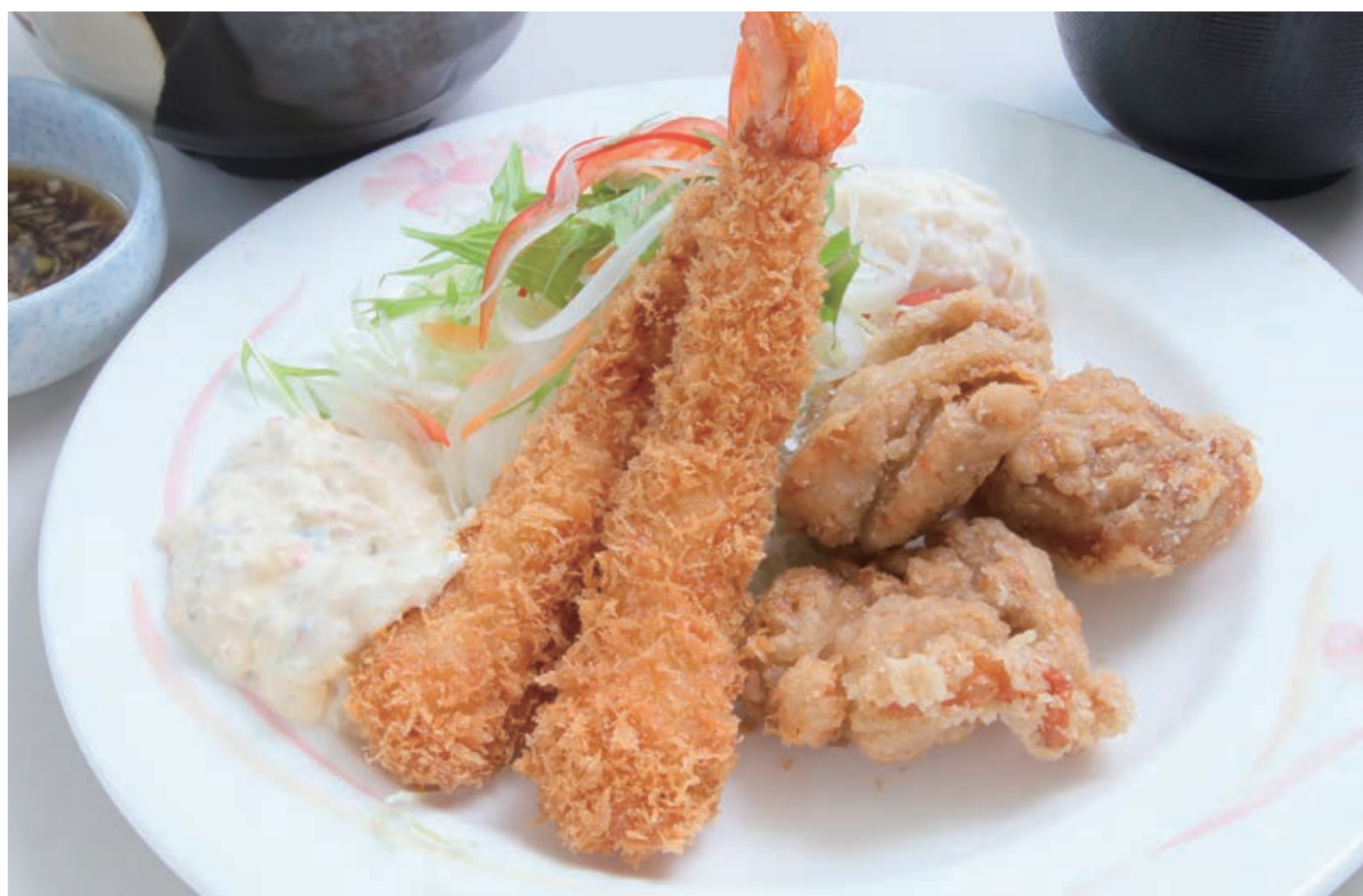
エビフライとから揚げ定食 ¥1,300